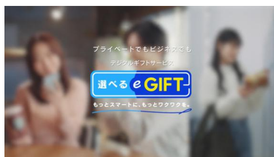
CM【選べる e-GIFT】「e こと」篇(30 秒) https://youtu.be/515nzLNSXik

今回のロゴリニューアルは、法人向けサービス・オンラインストア問わず、ブランド全体でのリニューアルとなります。2015年より使用していたロゴをベースとしつつ、贈る側・受け取る側双方に寄り添うデザインへアップデートいたしました。