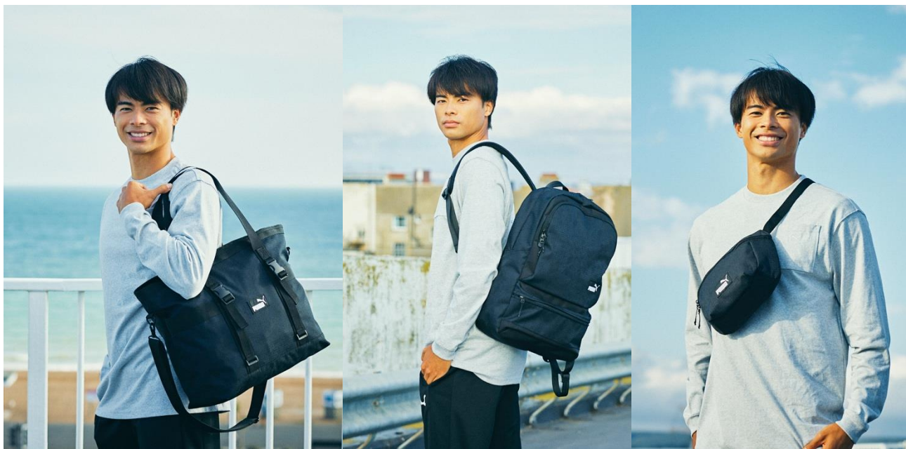
↑イメージカットは今回の 3 商品と三笥選手(商品 向かって左からトラベルトートバッグ、バックパック、ミニショルダー)

それに伴い、2023 年 6 月に ANA とスポンサー契約をしたサッカー三笥薫選手のサイン入りサッカーボールが抽選で当たるキャンペーンや、購入者全員への特典をご用意しました。