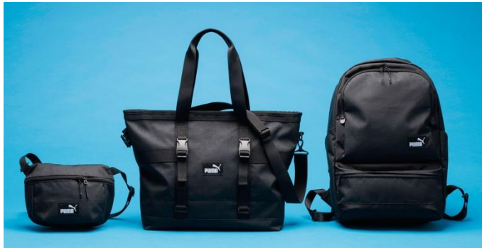
「PUMA for ANA」3 商品(↑)のいずれかを購入すると抽選でサッカー三笥薫選手のサイン入りサッカーボール(写真左上)が 4 名様に当たるキャンペーンも