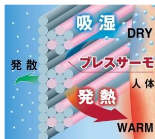
↑「プレスサーモ」機能イメージ