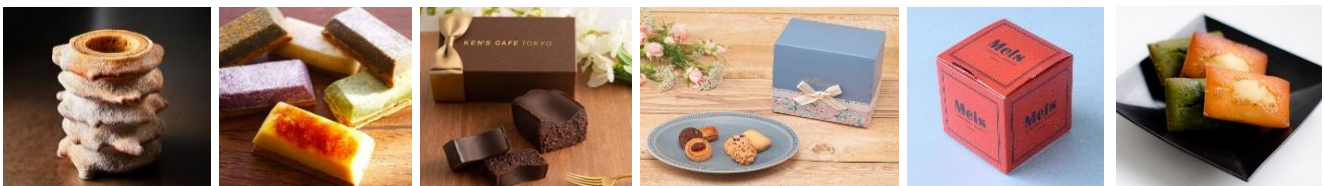
【空港初】 左から: アニバウム、OIMO、ケンズカフェ東京、フルーリア、メルズキャラメルワークス、ラ・マーレ・ド・チャヤ

11月には商品刷新の第二弾として、8ブランドの販売開始を予定しております。ANA FESTAはこれからも、「旅からつながる幸せ」を感じて頂けるよう、おひとりおひとりの想いに寄り添ったお店づくりを目指してまいります。