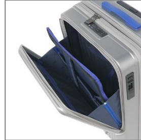
フロント収納内部