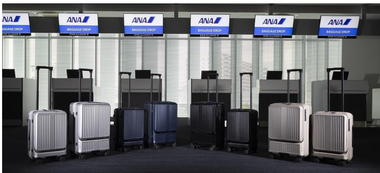
機内持ち込みサイズ(40L)、3～5 泊の旅行向けサイズ(55L) カラーバリエーション:(向かって左から)シルバー/ネイビー/ブラック/グレイージュ

6 月 30 日(金)より A-style および国内線機内/ラウンジ内の ANA Wi-Fi service からアクセスできるショッピングサイト「ANA STORE@SKY(以下、@SKY)」、7 月 7 日(金)より「ANA ショッピング A-style ANA Mall 店(以下、ANA Mall 店)」にて販売を開始します。