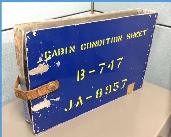
(左) Cabin Condition Sheet カバー ボーイング 747 (JA8957)

『SorANAKa ヤフオク!店』は、ANA で使用されていた現物をそのまま・一点物の航空機部品や ANA に関連するエアライングッズをオークション販売するサイトです。第5弾は、各航空機に1冊だけ搭載されていた ANA 整備士によるお手製 Cabin Condition Sheet カバーや、スケルトンカバーで覆われ機内の様子が細部に至るまで再現されたボーイング 777-300ER のカットモデル、そして大型のモデルプレーンなど、航空ファンや ANA ファンの皆様にぜひご購入いただきたい貴重なアイテムを11点出品いたします。