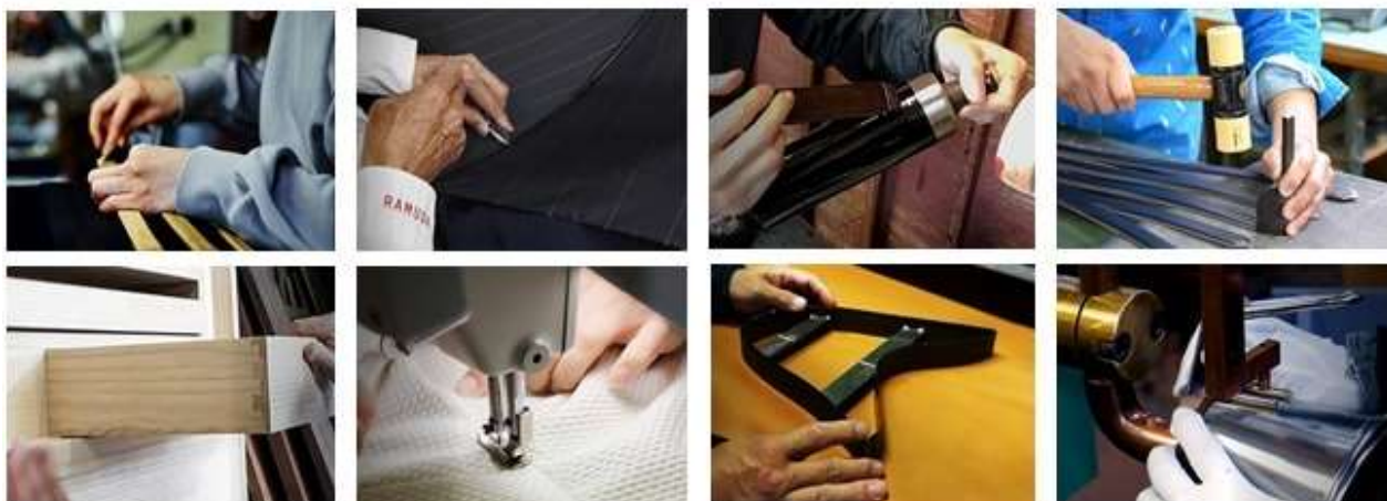
(上) kuska fabric (下) 鈴木石太郎タンス店