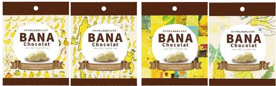
(画像左: 黒箱スタンド 65g、右: 小袋 30g パッケージ 4 種類)

パッケージには、障がいを持った方々が描いたバナナのアートを採用いたしました。この取り組みは、障がい者、高齢者、障がい児などのアート作品をパッケージに使用し、誰もが活躍できる世界を創るアートプロジェクト「HEART FOR ART」に賛同したものです。お菓子とともに、パッケージのデザインもお楽しみください。