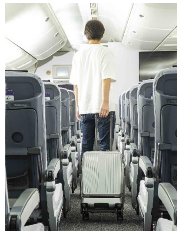
機内持ち込み対応可能※ 出張・旅行に便利なサイズ