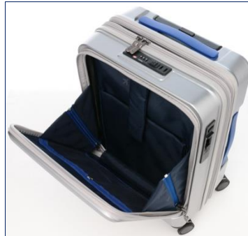
フロント収納内部