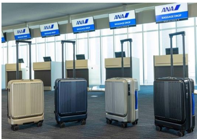
カラーバリエーション(向かって左から)グレージュ/ネイビー/シルバー/ブラック