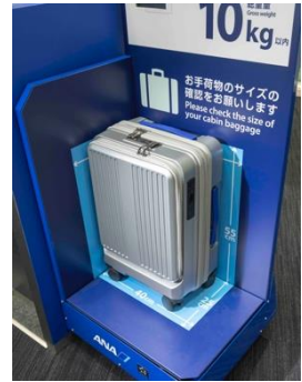
機内持ち込みサイズ なのに大容量