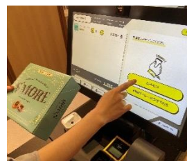
③ 出口のタッチパネルで購入商品を確認して決済する。