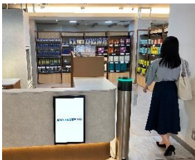
① 入口ゲートから入店する。

商品を手に取り、出口でタッチパネルの表示内容を確認し、お支払いするだけでお買い物が完了します。