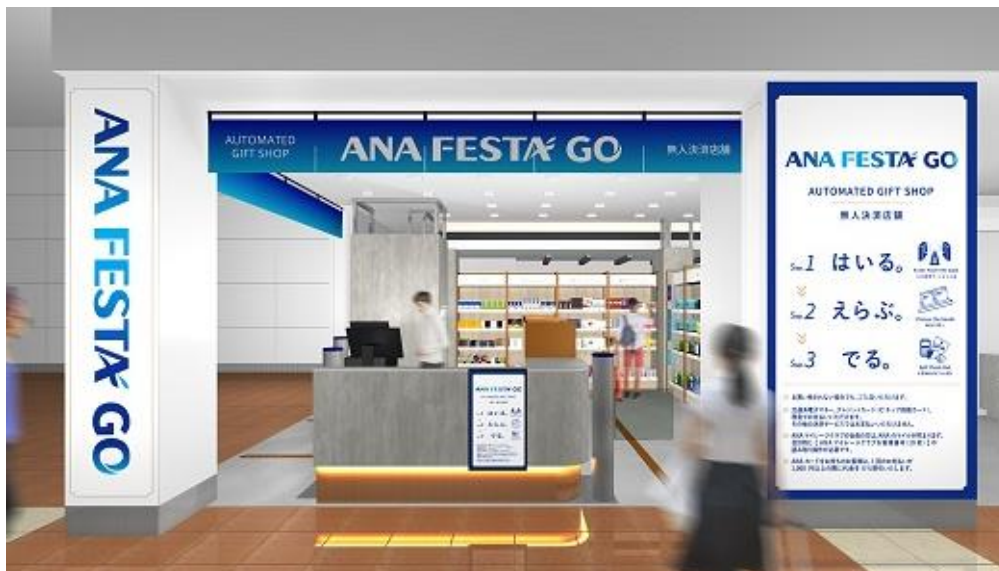
● 店舗 正面イメージ

※無人決済システムを活用した実用化店舗…ウォークスルー型の店舗で、カメラなどの情報から入店したお客様と手に取った商品をリアルタイムに認識して、決済エリアにお客様が立つとタッチパネルに商品と購入金額が表示され、表示内容を確認して支払うだけでお買い物ができる店舗を指します。