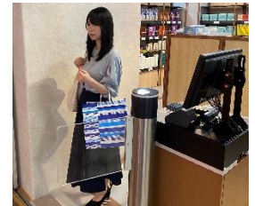
④ 出口ゲートから退店する。