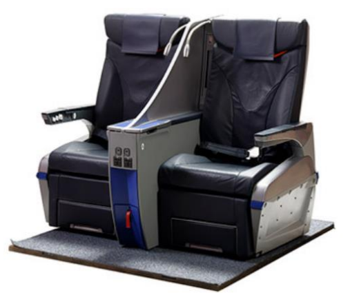
モックアップシート