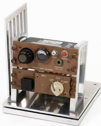
コックピットパネル