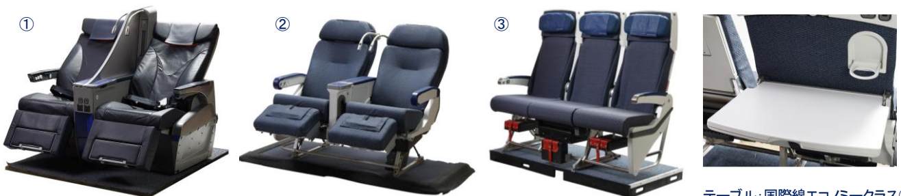
テーブル:国際線エコノミークラス③ (777-300ER)3席FBSタイプ

モックアップシートとは、機能性や快適性の技術検証などを行ったり、新シートのお披露目イベント等で使用している模型になります。実機から取りおろしたシートではなく、空を飛んではおりませんが、機能面はほぼ同仕様です。今回は、国内線、国際線の2席タイプ、国際線の3席タイプなど3種類のシートをご用意しています。