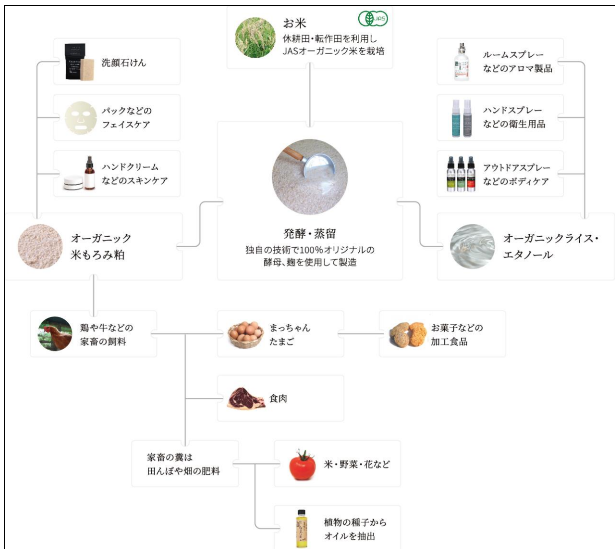
ファームステーションが構築する廃棄物ゼロの循環型モデル

また、エタノールの製造過程で生成される発酵粕は、化粧品原料や地域の鶏や牛の飼料として利用し、さらに鶏糞は水田や畑の肥料にするなど、廃棄物ゼロの循環型モデルを構築しています。