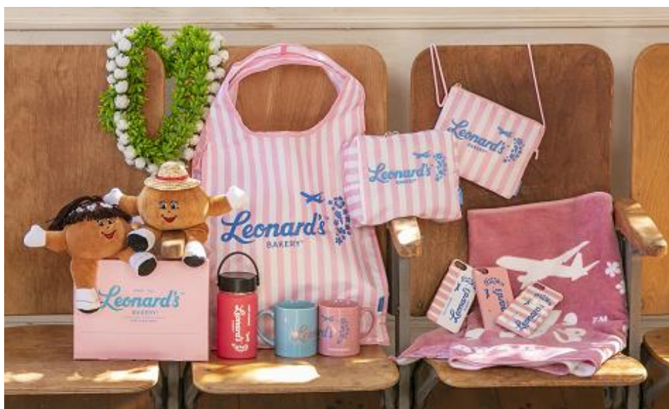
商品イメージ ※ぬいぐるみ、BOXは販売しておりません

今回初めてコラボレーションするレナーズは、ハワイで地元住民や観光客に親しまれている老舗ベーカリーです。看板商品のマラサダ(揚げパン)のほか、レナーズのイメージカラーでもあるピンクを使用したグッズも人気です。