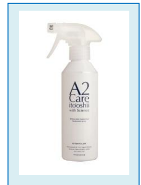
A2Care 300ml スプレー