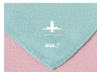
【特典: リバーシブル風呂敷】

最近では写真映えのする『インスタ映え』が話題となっていることもあり、新しいお正月の楽しみ方の提案として、見た目も鮮やかで美しい「迎春寿司」にこだわりました。安心安全な食材で、彩り豊かに仕上げることに苦勞し、試行錯誤の末、ようやく完成。日本料理の伝統を守りつつも、見ているだけで楽しいお寿司に仕上がっております。