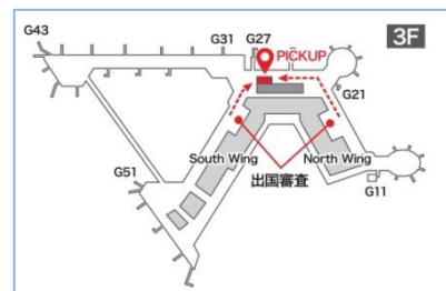
成田国際空港 第2ターミナル