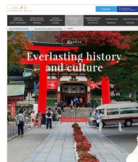
ウェブサイトイメージ