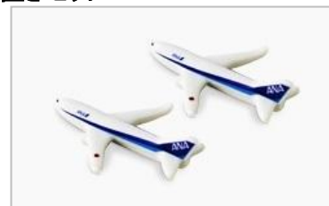
[特典:飛行機型箸置き×2セット]

特典として、今年 ANA B737 型機をかたどった箸置き 2 点がセットになっており、毎年異なる機種をご用意する箸置きは、飛行機好きにはたまらないアイテムとしてお楽しみいただいております。