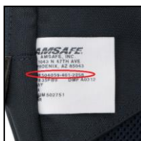
シートベルトのパーツ ナンバーが記載され たタグ