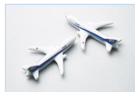
特典: 飛行機型箸置き × 2 セット

人気特典として、毎年 ANA 機をかたどった箸置き 2 点がセットで付いています。毎年異なる機種をご用意する箸置きは、飛行機好きにはたまらないアイテムとしてお楽しみいただいております。今年は B777 型機が登場です！