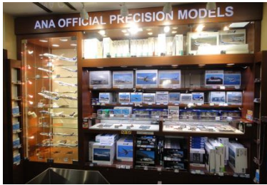
ANA FESTA 羽田店 羽田到着ロビーギフトショップ モデルプレーン展示販売コーナー