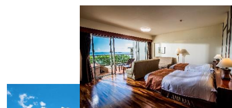
ホテルイメージ写真 （客室はオーキッド）