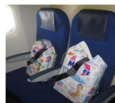
（おむつ交換台付トイレ付近のおむつコーナー：イメージ）